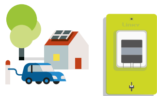
LE COMPTEUR LINKY

enregistre la consommation quotidienne et globale de votre foyer en kWh